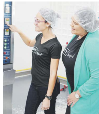
Las galletas Tasty Smart se confeccionan desde 2019 en Vega Baja, suministrada